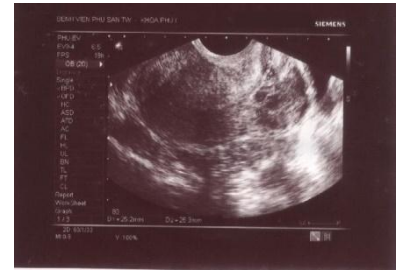
Hình 1c. Sau hút 7 ngày, khối âm vang hỗn hợp 25x25mm tại sẹo mổ cũ

Chú ý: Trong trường hợp chảy máu có thể dùng một số biện pháp cầm máu sau (có thể phối hợp nhiều biện pháp):