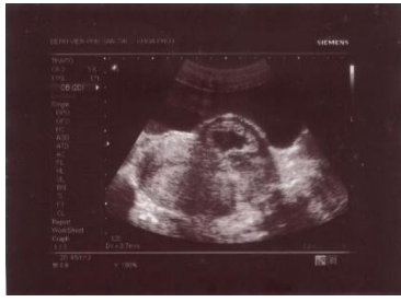
Hình 1a. Hình ảnh chưa hút tại vết mổ lấy thai cũ, lòi vào bàng quang