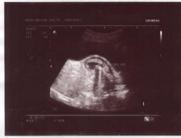
Hình 1b. trong khi hút (hình ảnh đầu ống hút trong túi ối)